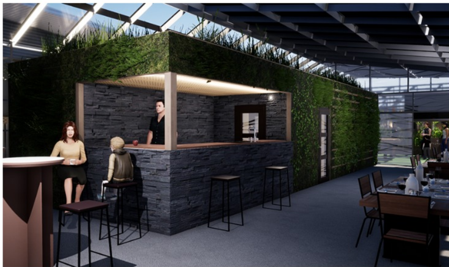
© Nicolas Sandt (la future cuisine en béton végétale)