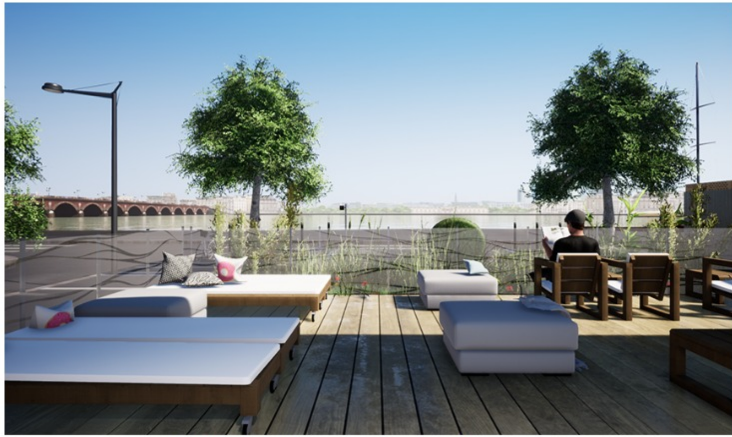
Nicolas Sandt (Vue sur la Garonne depuis la terrasse. ©)

La construction même prendra la forme d'un chantier collaboratif fondé sur des méthodes alternatives, avec par exemple une cuisine en béton végétal signée Modulem, des bureaux plateaux télé en ossature bois par Suteki, une maison en carton recyclé fabriquée par Bat'ipac ou encore des dortoirs en pièces de bois créées par Brickawood .