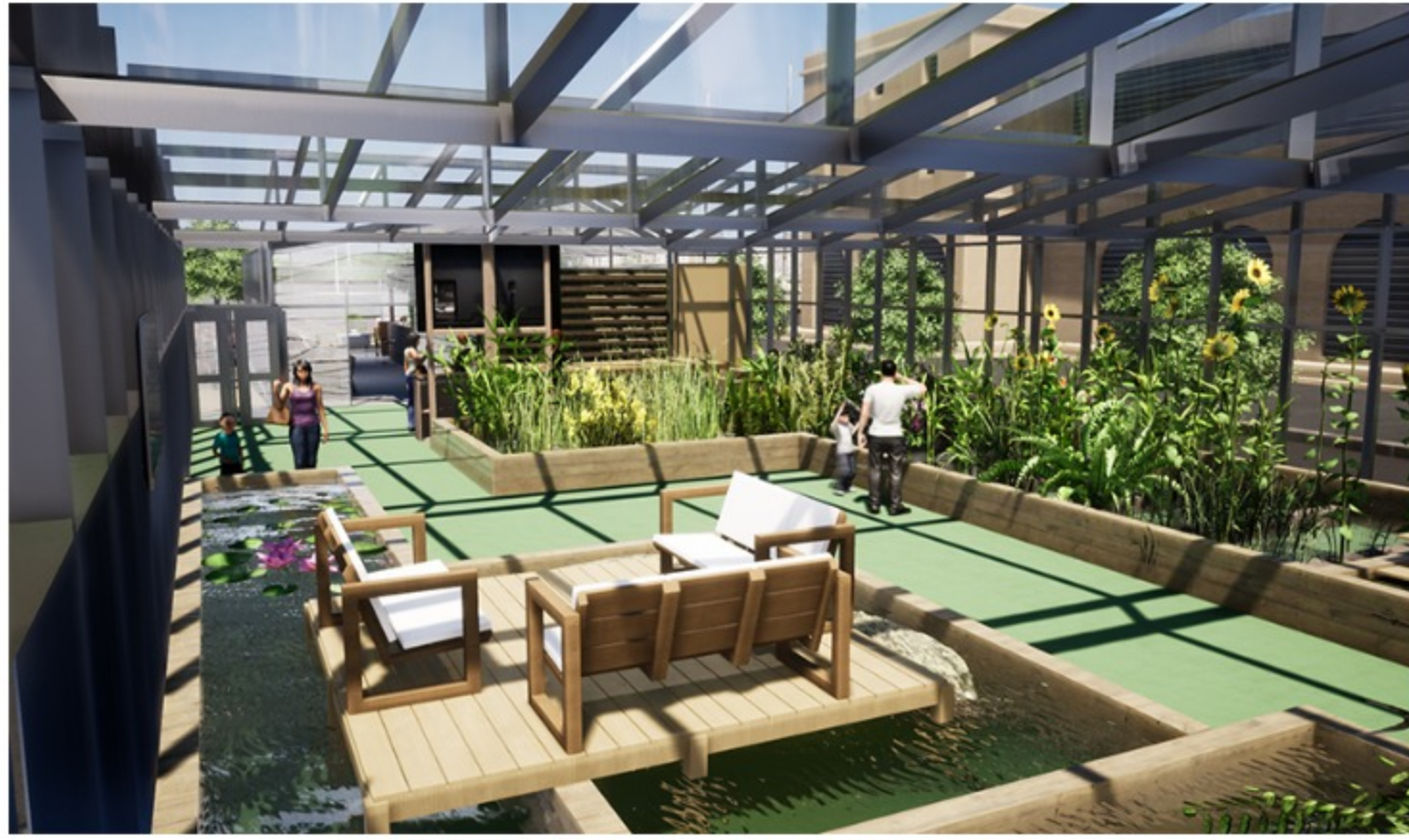
© Nicolas Sandt (Une serre urbaine à l'intérieur de la villa)